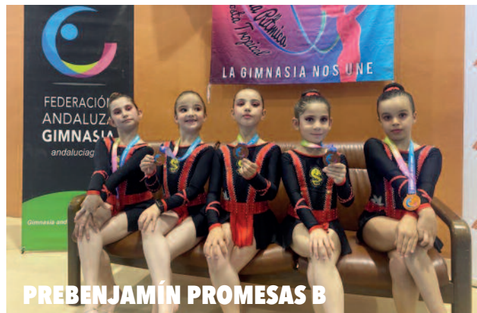
PREBENJAMÍN PROMESAS B

El equipo cadete masculino del CB Peligros se proclamó campeón del décimo segundo Torneo de Semana Santa que organiza el CB Aldaba de Almería, y que se celebró del 2 al 5 de abril en la localidad almeriense de El Toyo. Participaron más de 1.200 jugadores y jugadoras repartidos en 106 equipos de distintas categorías, procedentes de veinte clubs de toda España.