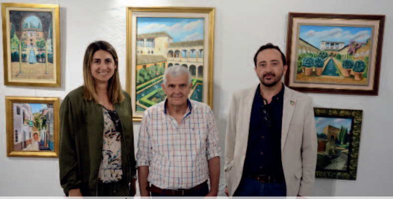
EXPOSICIÓN DE PINTURA DE MIGUEL MORENO BLANCA.