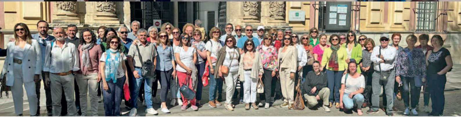
VIAJE DEL TALLER MUNICIPAL DE PINTURA AL MUSEO DE BELLAS ARTES DE SEVILLA.