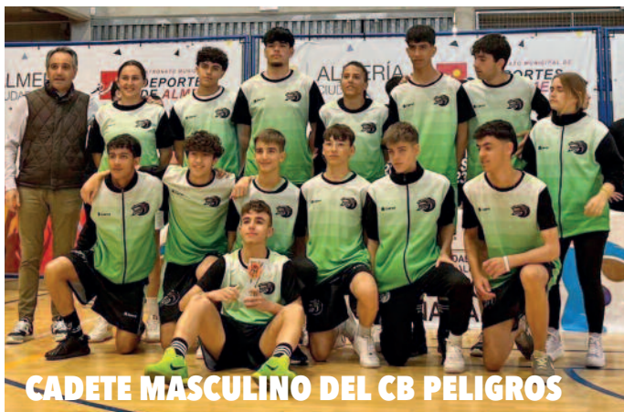
CADETE MASCULINO DEL CB PELIGROS