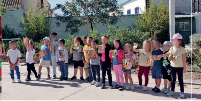
CELEBRACIÓN DEL DÍA DE LA TIERRA CON LOS ALUMNOS Y ALUMNAS DE INFANTIL Y PRIMARIA DE LOS DOS COLEGIOS.