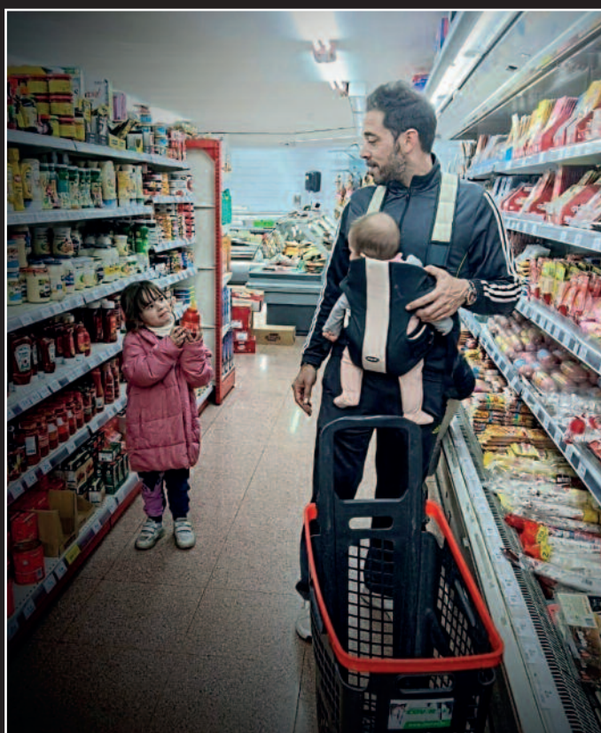
Tercer premio: ¿Y tú por qué no trabajas? Autora: Patricia Torres Fernández.