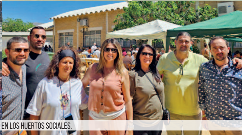
JORNADA DE CONVIVENCIA EN LOS HUERTOS SOCIALES.