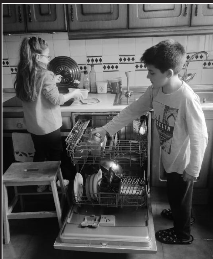
Segundo premio: Niño y niña en igualdad. Autora: Nerea Pérez Ibáñez.