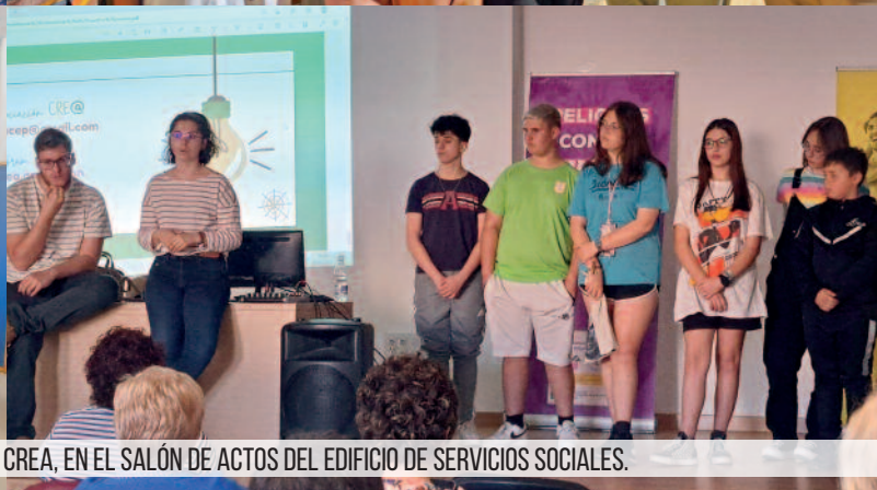
CHARLA ENTENDIENDO A NUESTROS JÓVENES, CON LA ASOCIACIÓN CREA, EN EL SALÓN DE ACTOS DEL EDIFICIO DE SERVICIOS SOCIALES.