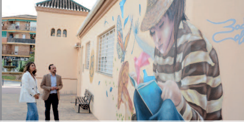
NUEVO GRAFITI PARA CELEBRAR EL 20 ANIVERSARIO DE LA BIBLIOTECA MUNICIPAL.