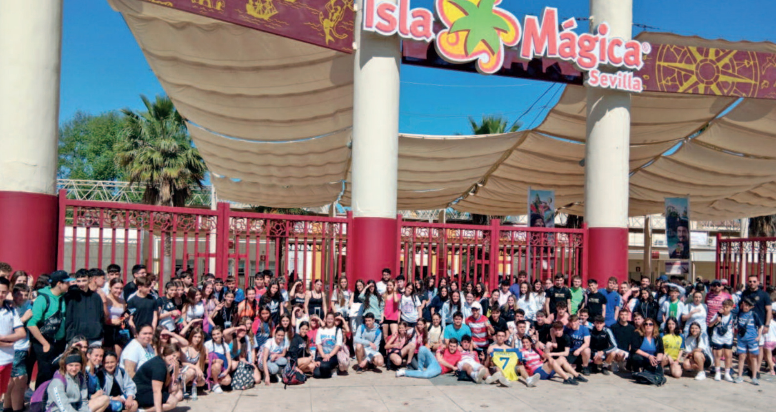
145 JÓVENES DISFRUTARON DEL VIAJE A ISLA MÁGICA ORGANIZADO POR LA CONCEJALÍA DE JUVENTUD.