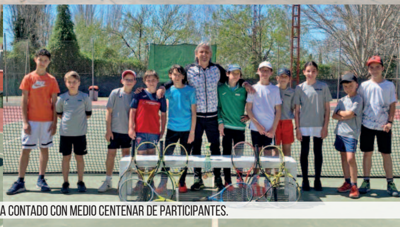
PRIMER TORNEO DE TENIS DE SEMANA SANTA, QUE HA CONTADO CON MEDIO CENTENAR DE PARTICIPANTES.